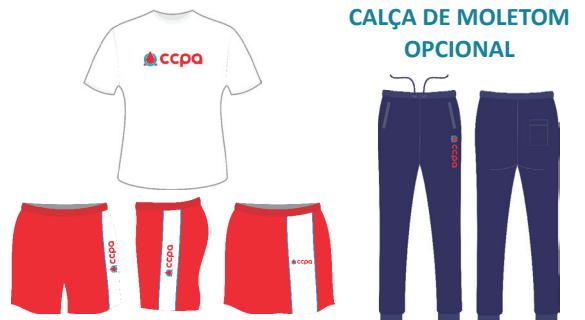
CALÇA DE MOLETOM OPCIONAL